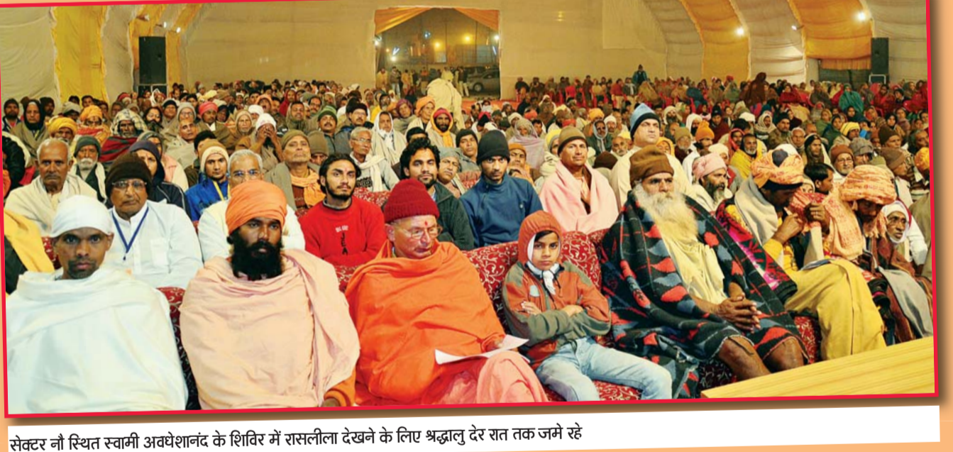
सेक्टर नौ स्थित स्वामी अवधेशानंद के शिविर में रासलीला देखने के लिए श्रद्धालु दर रात तक जमे रहे