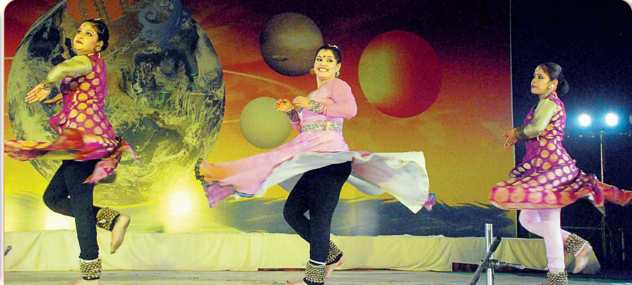
चलो मन गंगा यमुना तीर में कथक नृत्य प्रस्तुत कर सुरभि ने दर्शकों के मन के तार झकृत कर दिए।