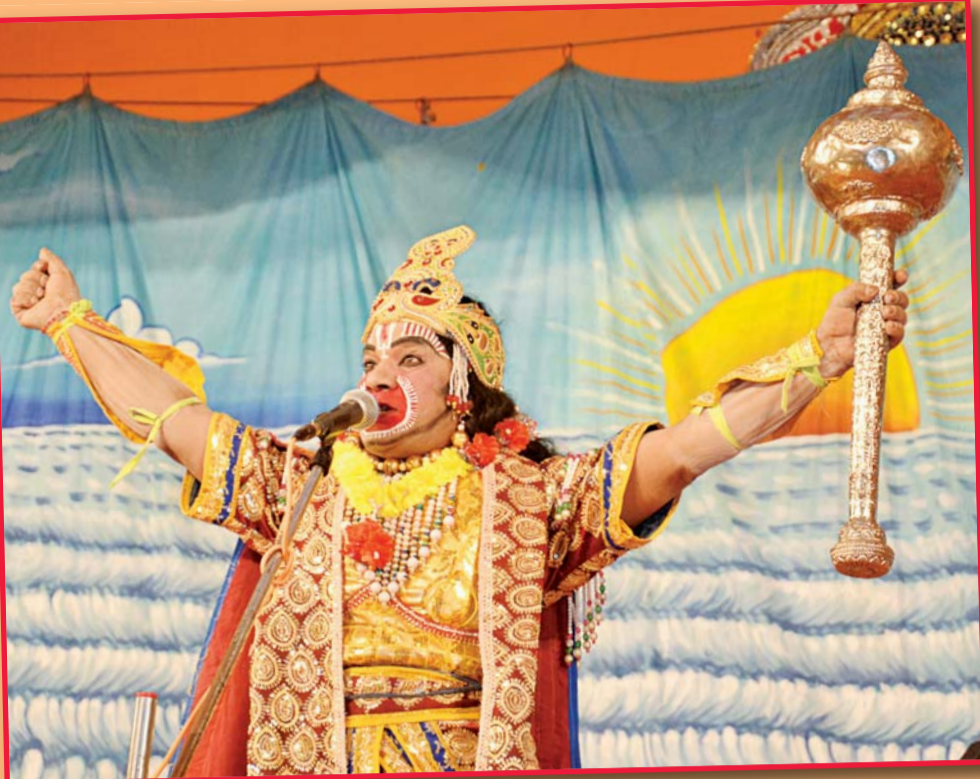
विश्व कल्याण मिशन ट्रस्ट हरिद्वार के शिविर में हनुमान जी के अभिनय से कलाकार ने रोमांचित किया