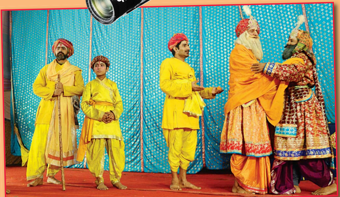
सेक्टर 9 स्थित कैलाशानंद के शिविर में कलाकारों ने रासलीला का भावपूर्ण मंचन किया