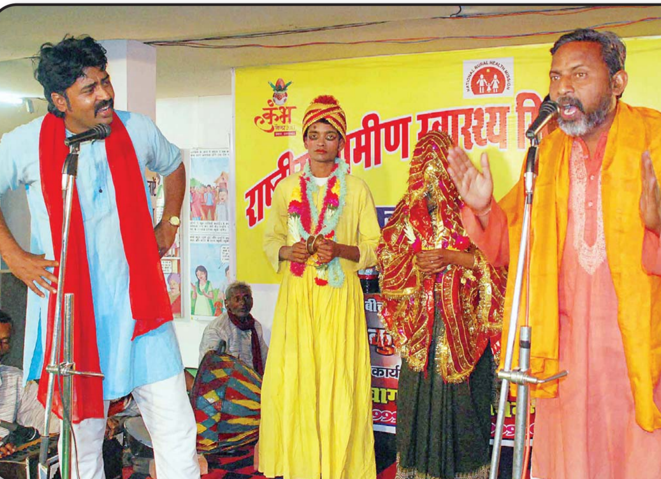
स्वास्थ्य विभाग द्वारा आयोजित कार्यक्रम जनसंख्या नियंत्रण पर नौटंकी के माध्यम से कलाकारों ने जागरूक किया