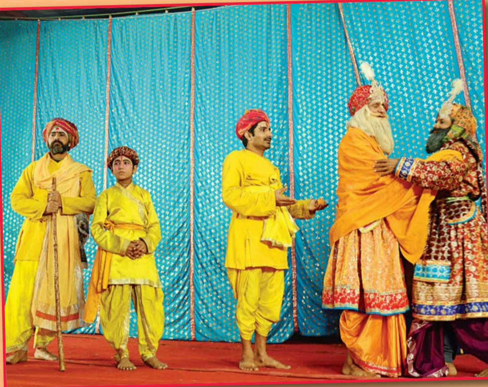
सेक्टर नौ स्थित कैलाशानंद के शिविर में रासलीला का भावपूर्ण मंचन किया गया