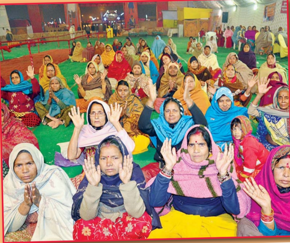
सेक्टर नौ स्थित श्री राम श्याम लीला संस्थान में रासलीला देखने के लिए दर रात तक श्रद्धालुओं ने आनंद लिया